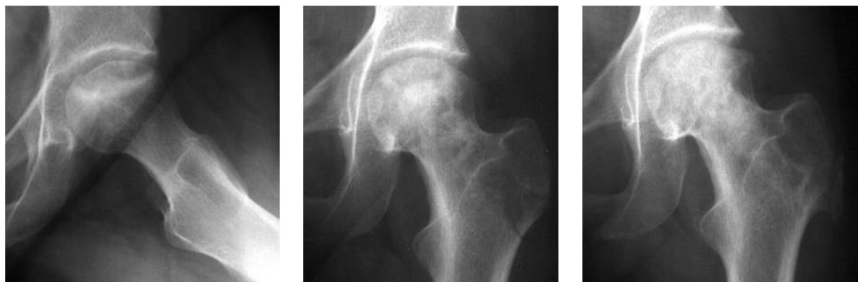
Ryc. 2. Martwica głowy kości udowej przed, bezpośrednio po i 7 lat po operacji Fig. 2. Femoral head osteonecrosis before, immediately after and 7 years after surgery

Average follow-up was five years (from one to 12 years). A follow-up examination of all patients was performed one year post surgery. During the follow-up period, pain relief with preservation of a spherical femoral head was obtained in 45 hips (63%) (Fig. 1). This outcome was achieved in seven hips classified preoperatively as ARCO stage II, 29 hips classified as stage III and nine graded as stage IV. Sixteen hips (22%) had a significant limitation of the range of motion that, however, never exceeded preoperative values, without significant pain during walking, and with radiographic loss of the spherical shape of the femoral head. Almost all hips in this group were preoperatively classified as ARCO stage IV, with only one classified as stage III. The remaining 11 hips (15%), all ARCO stage IV preoperatively, required an arthroplasty during the first 18 months after core decom-