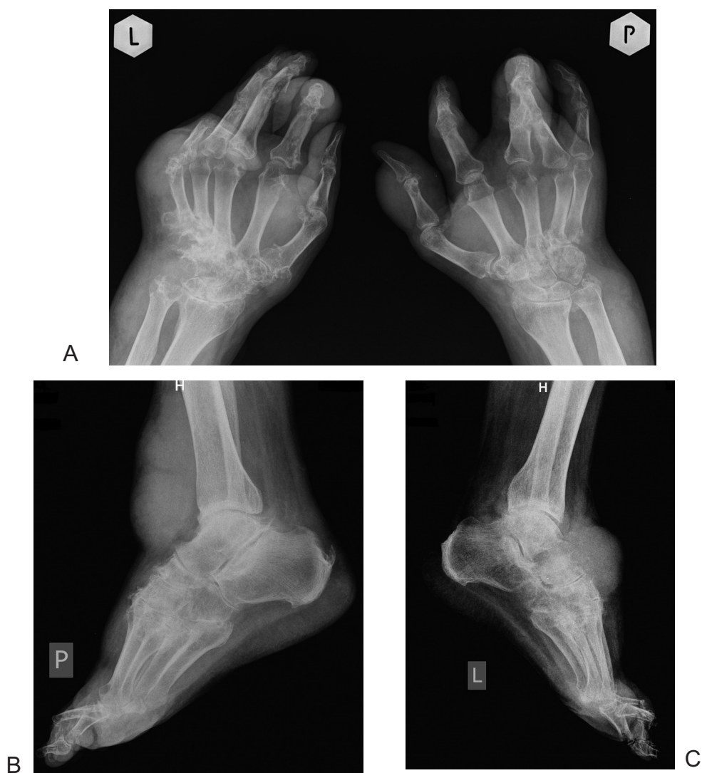
Ryc. 3. Zdjęcia rtg przedstawiające zniekształcenia i zmiany guzowate: obu rąk (a), stopy i stawu skokowego prawego (b) oraz stopy i stawu skokowego lewego (c)