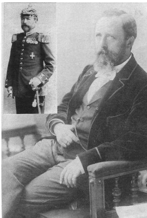
Ryc. 2. Prof. Jan Mikulicz-Radecki, 1890 r.