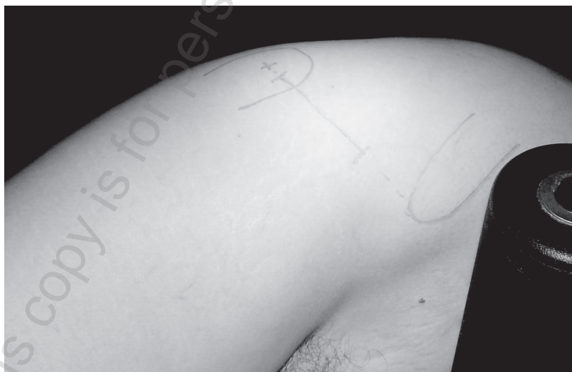
Ryc. 1. Umieszczenie cięcia skórno-pomiędzy szczytem krętarza większego a kolcem biodrowym górnym przednim Fig. 1. The cutaneous incision line is placed between the tip of the greater trochanter and the anterior superior iliac spine

It is the anterior approach that follows the principles of MIS best as it makes possible implantation of a hip joint endoprosthesis without damage to muscles or their insertions. This approach was first described by Robert Judet in 1947 as a modification of the Smith-Peterson approach. Judet used an orthopedic table with indirect traction applied to both feet, as traction applied to the lower limbs combined with traction and simultaneous external rotation and overextension in the hip joint of the treated limb facilitates hip joint dislocation [2]. Current modifications of the technique do not require an orthopedic table and traction to the lower limbs. The procedure can now be performed on a flat-top table. The proximal femoral shaft is covered posteriorly and laterally with the gluteus maximus muscle and the gluteus medius muscle as well as their insertion site,